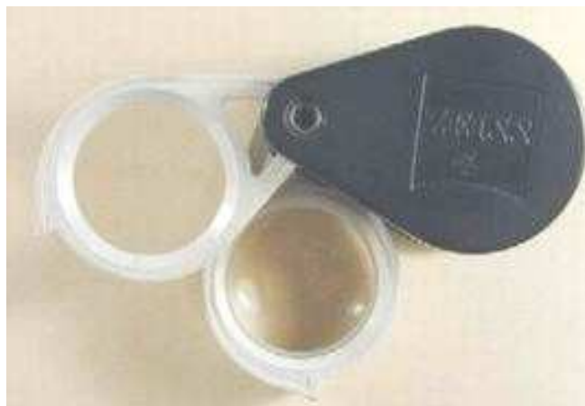
Loupe Zeiss, constituée de deux loupes x6 ou x3, soit les deux loupes superposées x9

Pour ma part , après diverses expériences, j'ai adopté le modèle Zeiss double x6 x3; mais le modèle simple, x6 est très suffisant dans la grande majorité des cas d'utilisation. Leur seul défaut est leur prix assez élevé.